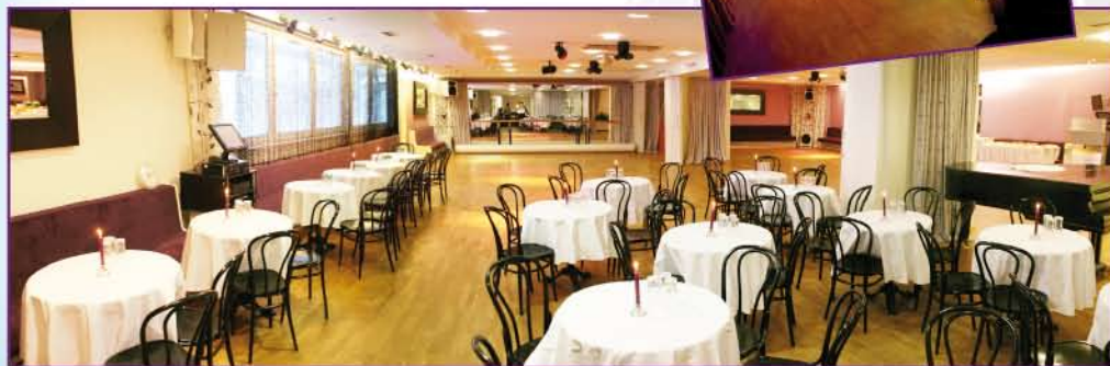
Saal 1 & 2